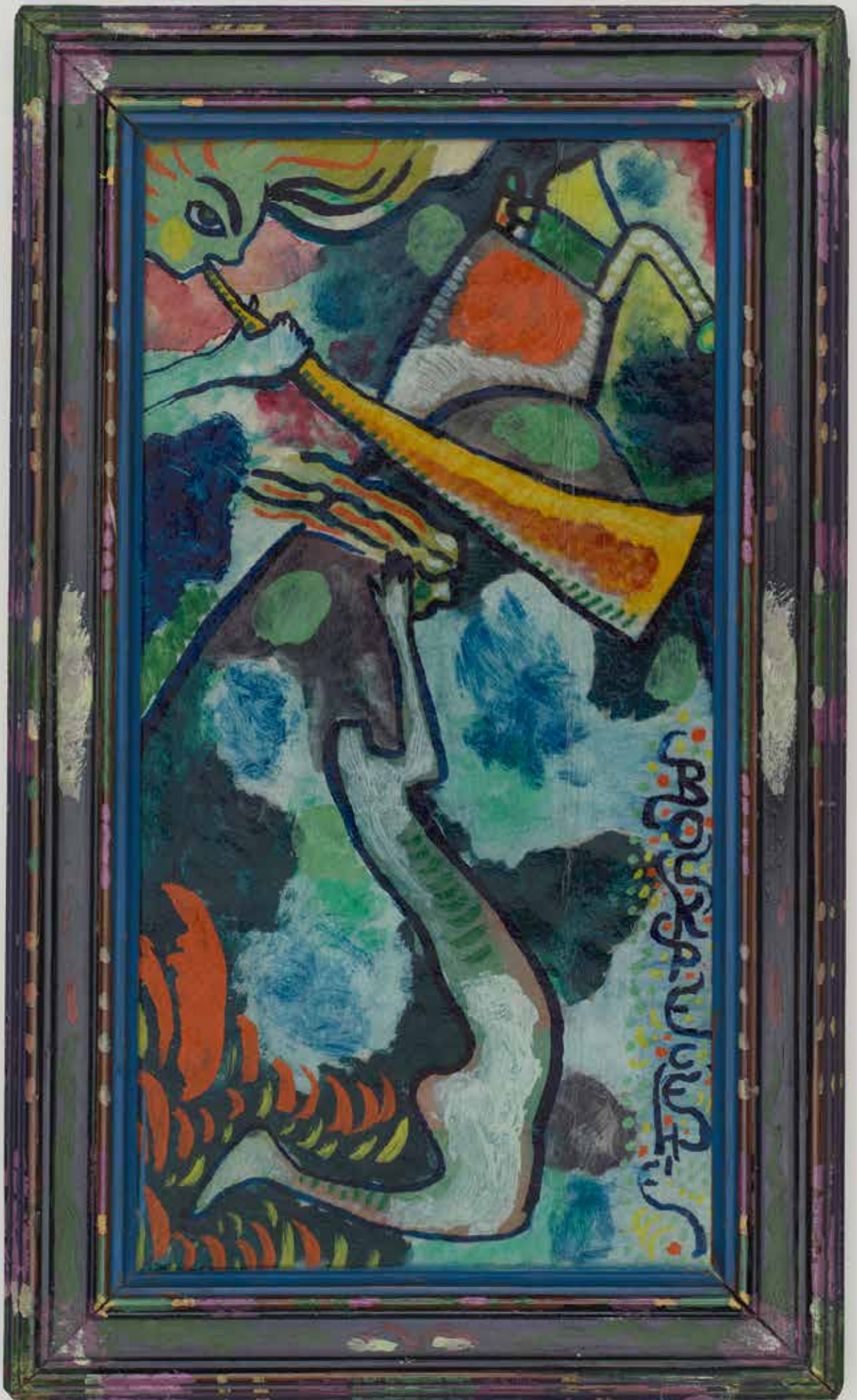
Wassily Kandinsky, Opstanding (Het jongste gericht), 1911, 21,8 x 11,4 cm., Lenbachhaus, München