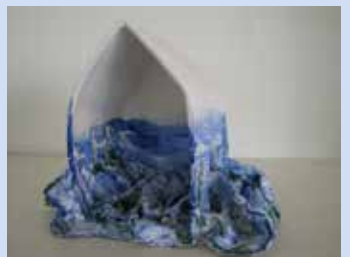
Serie huizen, Coby van der Stoep Keramiek, formaat ongeveer 20x20x28cm.