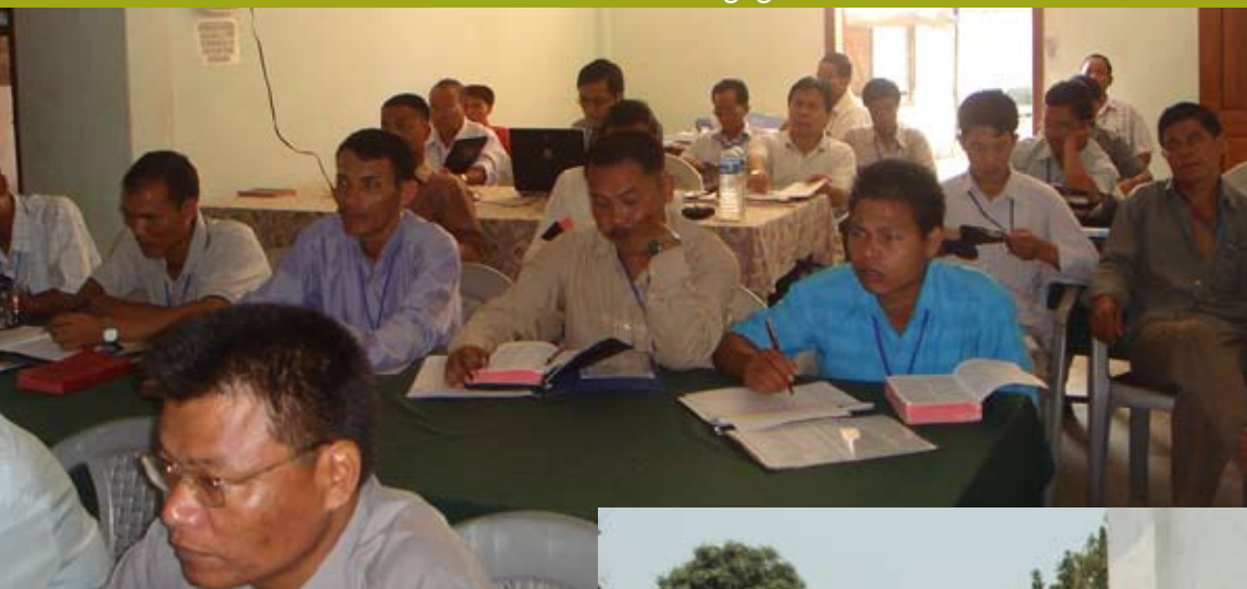
Theologische opleiding PTS in Dehra Dun, India