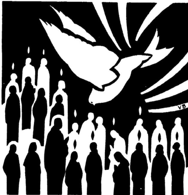
Handelingen 2:17-21 en 2:38